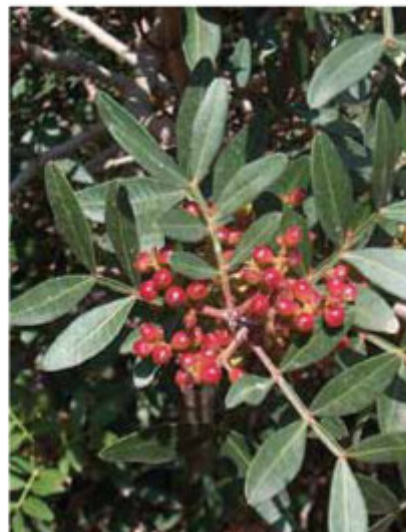
Llentiscle. Lentisco. Pistacia lentiscus. Mastixstrauch. Arbre au mastic. (Pistacia lentiscus).

The trail starts at the parking lot of the Cementerio Municipal (municipal cemetery) and heads up north until you reach the Font de la Mata (spring), passing by the place where the rock was located. From the Font de la Mata , where you can rest and refill water, the path goes through a wooded area and comes upon the ruins of Xaparrundos , a country house, dating back to the 19th century. Continuing past Xaparrundos, you ascend to the Serrellars , the highest point of the excursion, where one can enjoy unbeatable views of Montgó, Bèrnia, Sierra de Oltà and Segaria. Descending through the Mallà Verda area, the beautiful path will take you back to the road leading to the cemetery, the starting point.