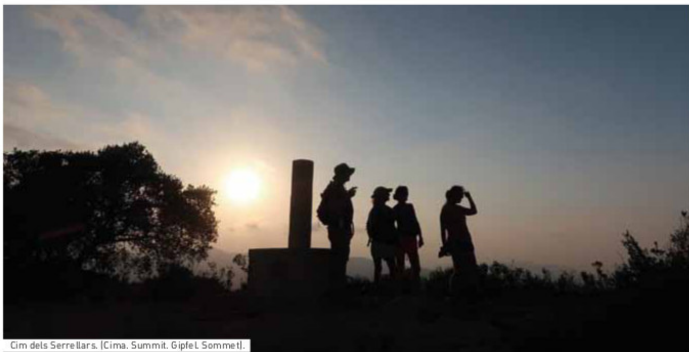
Cim dels Serrellars. [Cima. Summit. Gipfel. Sommet].

☑ Dieser Wandervorschlag verläuft auf dem alten Weg der Ribereros (Landwirte und Tagelöhner), die sich in den Ribera-Kreis an die Ufer des Júcar-Flusses begaben, um dort in der Aussaat und Ernte von Reis zu arbeiten. Die Route ist von tiefer emotionaler Bedeutung für Benissa, da sie an die harten Zeiten erinnert, als viele Bewohner zeitweise emigrieren mussten, um überleben zu können. Der Weg, der auch als Camí Assegador Vell de València (alter Viehweg nach Valencia) bekannt ist, führt durch die schmale Garganta-Schlucht und endet im Gebiet Ventas de Pedreguer. Kurz bevor die Ribereros damals den Kirchturm von Benissa ganz aus ihren Augen verloren, auf der Höhe eines großen Felsens, blickten sie noch einmal zurück und sprachen ein Gebet zu der Schutzheiligen Puríssima Xiqueta, damit diese sie auf ihrer Reise beschütze.