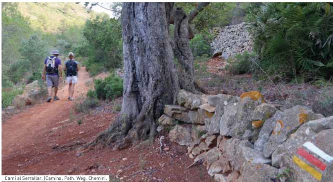
Cami al Serrallar. [Camino. Path. Weg. Chemin].

VA Aquesta proposta senderista recorre l'antic camí que seguien els Riberers [agricultors i jornalers] que es desplaçaven a la comarca de la Ribera del Xúquer per a treballar en la sembra i sega de l'arròs. La ruta té un marcat sentit afectiu i emocional per a Benissa, ja que rememora la duresa d'aquells que havien d'emigrar temporalment per a poder subsistir. El camí, conegut també com el Camí Assegador Vell de València , travessava l'estret pas de la Gola i acabava a les Vendes de Pedreguer. Poc abans de perdre de vista el campanar de Benissa, a l'altura d'una roca, els Riberers es pegaven la volta i resaven una salve a la Puríssima Xiqueta perquè els protegira durant el viatge.