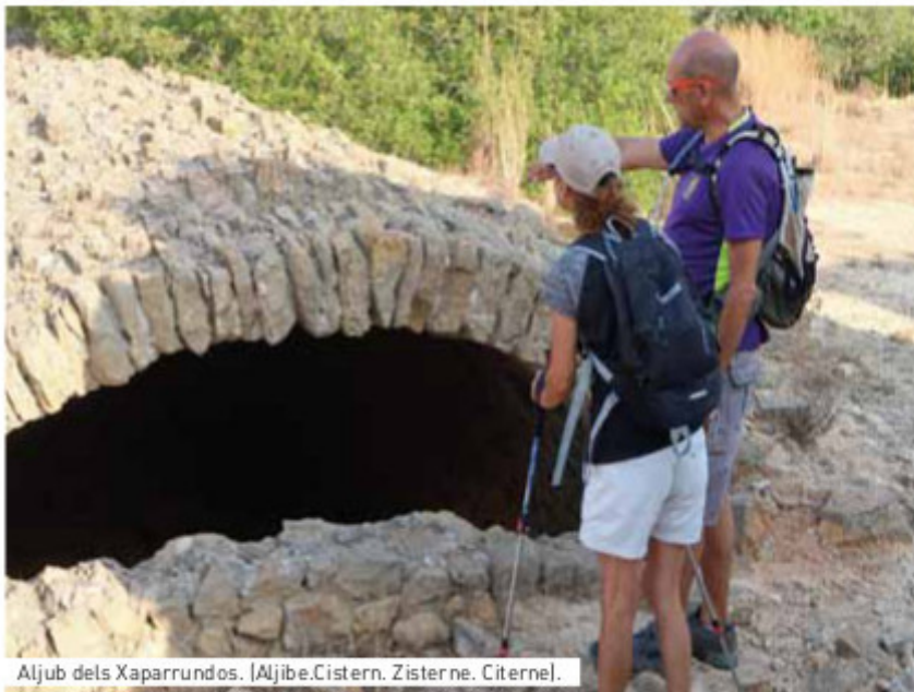
Aljub dels Xaparrundos. [Aljibe.Cistern. Zisterne. Citerne].