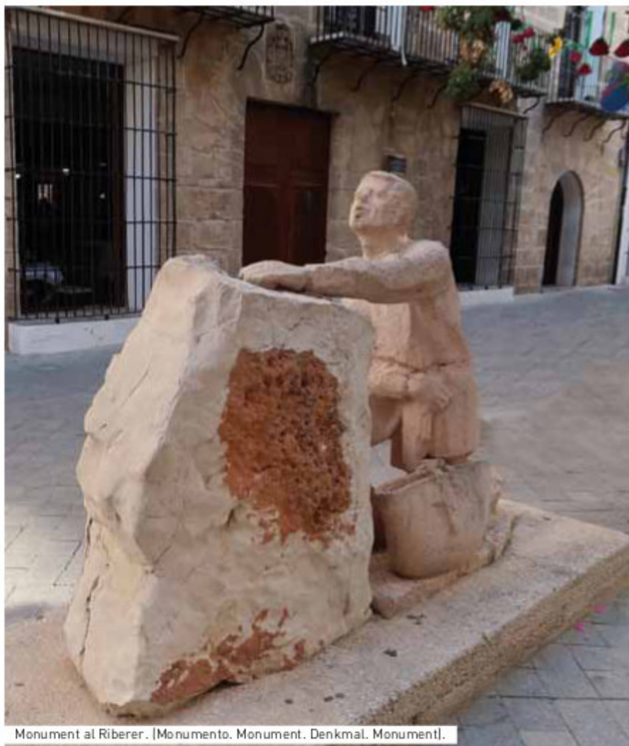
Monument al Riberer. [Monumento. Monument. Denkmal. Monument].

Esta propuesta senderista recorre el antiguo camino que seguían los Ribereiros (agricultores y jornaleros) que se desplazaban a la Ribera del Júcar para trabajar en la siembra y siega del arroz. La ruta tiene un marcado sentido afectivo y emocional para Benissa, ya que rememora la dureza de aquellos que tenían que emigrar temporalmente para poder subsistir. El camino, conocido también como el Camí Assegador Vell de València (camino azagador), atravesaba el estrecho paso de la Garganta y acababa en las Ventas de Pedreguer. Poco antes de perder de vista el campanario de Benissa, a la altura de una roca, los ribereiros se daban la vuelta y rezaban una salve a la Purísima Xiqueta para que les protegiese durante el viaje.