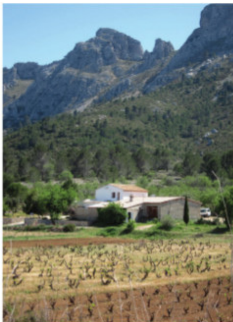
Fort de Bèrnia. [Fuerte. Fortress. Festung. Fort].

There are two tracks that run through the most representative landscapes of this mountain range. The first, the PR-CV 7 , has its starting point at Cases de Bèrnia (houses), and heads up to the Font de Bèrnia (spring) on the shady side of the mountain. From Font de Bèrnia, the path climbs steeply up the slopes until reaching El Forat (the hole), a remarkable natural passage that connects the two sides of the mountain. Once on the south side, the views will leave you breathless. The track continues without losing height until the Fort de Bèrnia (fortress), an ancient fortress built during the reign of Felipe II, to control and stifle the Moorish revolts. Remains of vaults, walls and the moat can still be seen. The other path, PR-CV 436 , crosses the mountain by the Paset (pass) and links the Ermita de Pinos (chapel) with Altea la Vella . This track connects to the PR-CV 7 on both sides of the mountain, allowing you to convert this route into a long-distance trek.