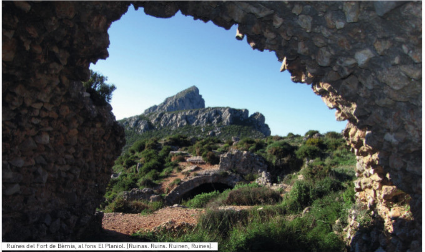
Ruïnes del Fort de Bèrnia, al fons El Planiol. [Ruinas. Ruins. Ruinen, Ruines].

Die Sierra Bèrnia ist eine imposante Gebirgskette, die auf die Gemeindegebiete von Altea, Benissa, Calp, Callosa d'En Sarrià und Xalò entfällt und wie eine immense natürliche Wand mit einem ausgeprägten Profil majestätisch die alicantiner Kreise Marina Alta und Marina Baja voneinander trennt. Sowohl ihre Lage wie auch ihre Höhe (1129 m über dem Meeresspiegel) verleihen ihr eine Silhouette von alpinem Charakter. Vom Gipfel der Bèrnia hat man einen fantastischen Ausblick über die gesamte Küste der Costa Blanca, ihre tiefen Täler und mediterranen Berge.