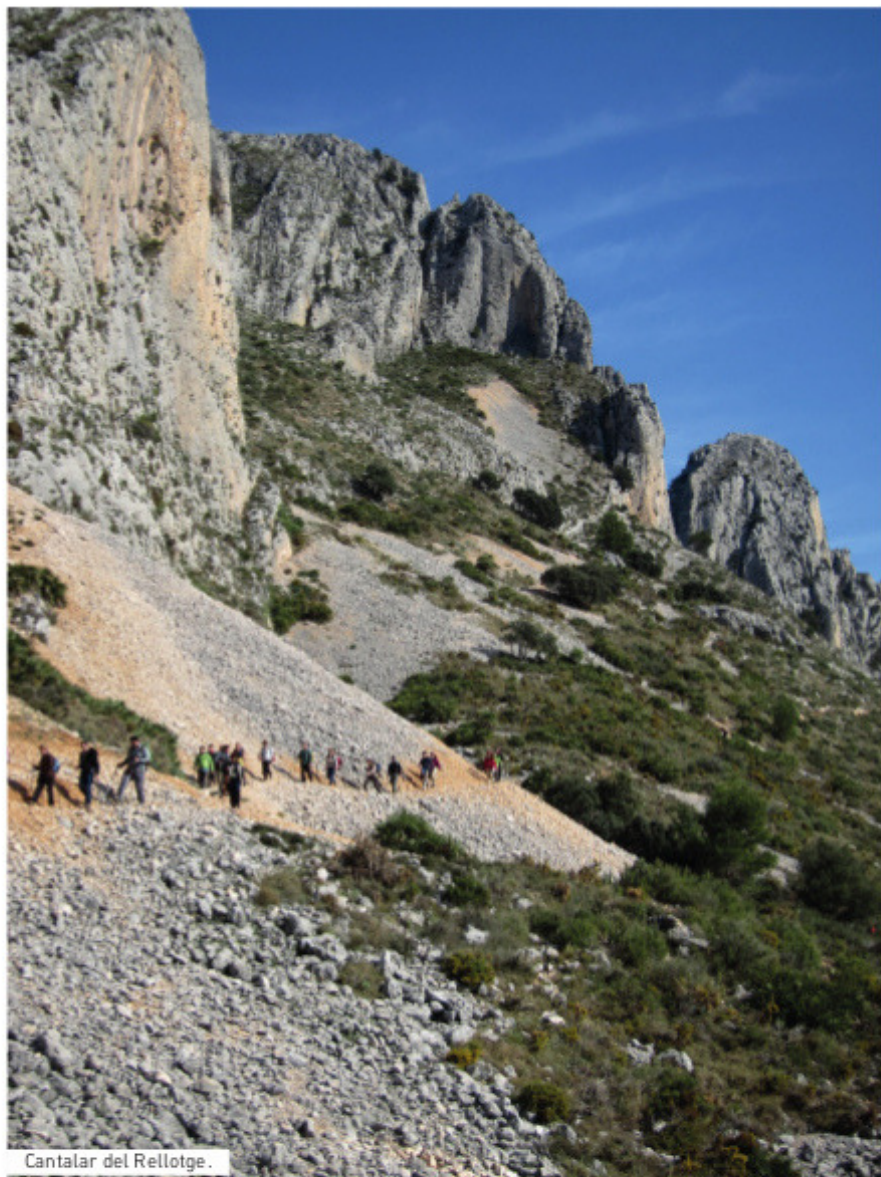
Cantalar del Rellotge.

Compartida entre los términos municipales de Altea, Benissa, Calp, Callosa d'En Sarrià y Xaló, la sierra de Bèrnia es una inmensa muralla natural de perfiles vigorosos que se alza majestuosa separando las comarcas alicantinas de la Marina Alta y la Marina Baja. Tanto por su orientación como por su altura (1129 m sobre el nivel del mar), la sierra de Bèrnia tiene una silueta de marcado carácter alpino y desde su cumbre se contemplan magníficas vistas sobre todo el litoral de la Costa Blanca y los profundos valles y montañas mediterráneas.