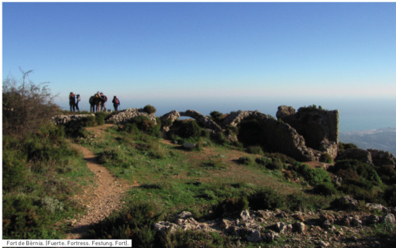
Fort de Bèrnia. [Fuerte. Fortress. Festung. Fort].

7.2 Compartida entre els termes municipals d'Altea, Benissa, Calp, Callosa d'en Sarrià i Xaló, la serra de Bèrnia és una immensa muralla natural de perfils vigorosos que s'alça majestuosa separant les comarques alacantines de la Marina Alta i la Marina Baixa. Tant per la seua orientació com per la seua altura [1129 m sobre el nivell del mar], la serra de Bèrnia té una silueta de marcat caràcter alpi i des del seu cim es contemplen magnífiques vistes de tot el litoral de la Costa Blanca i les profundes valls i muntanyes mediterrànies.