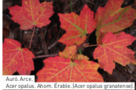
Auró. Arce. Acer opalus. Ahorn. Érable. (Acer opalus granatense).