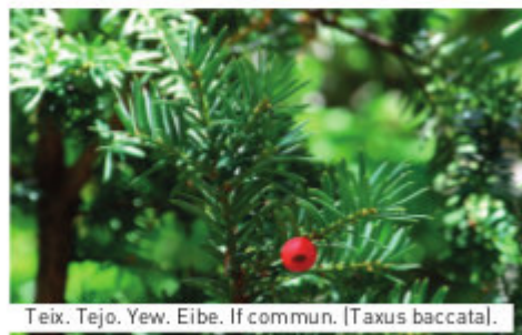
Teix. Tejo. Yew. Eibe. If commun. (Taxus baccata).