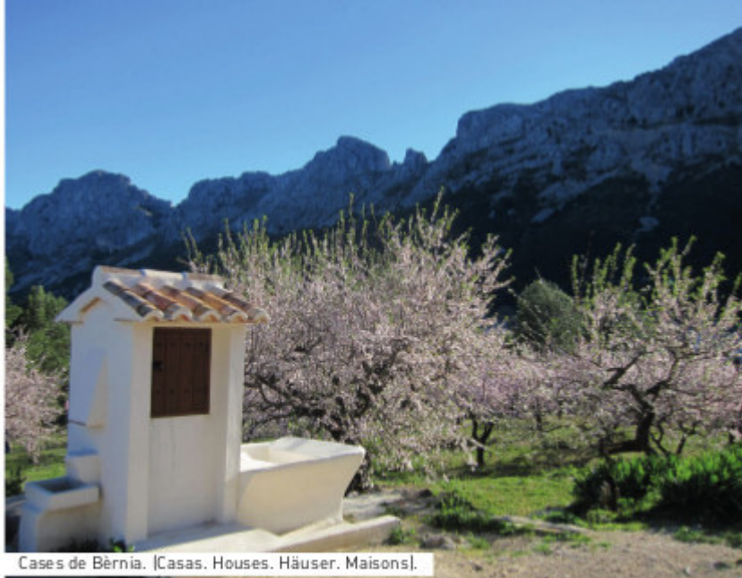
Cases de Bèrnia. (Casas. Houses. Häuser. Maisons).